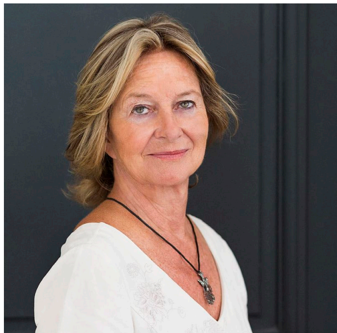
Marie de Hennezel

Non si può non apprezzare questo libro, frutto della lunga esperienza dell'autrice nelle cure palliative e nell'assistenza ai morenti. La Hennezel ha elaborato una disciplina particolare, l' aptonomia , consistente in un approccio tattile affettivo verso il morente. Questi si sente spesso isolato e respinto, soprattutto se è devastato da una malattia che compromette la sua immagine fisica esterna, e il ripristino di un rapporto più diretto e personale gli dà conforto.