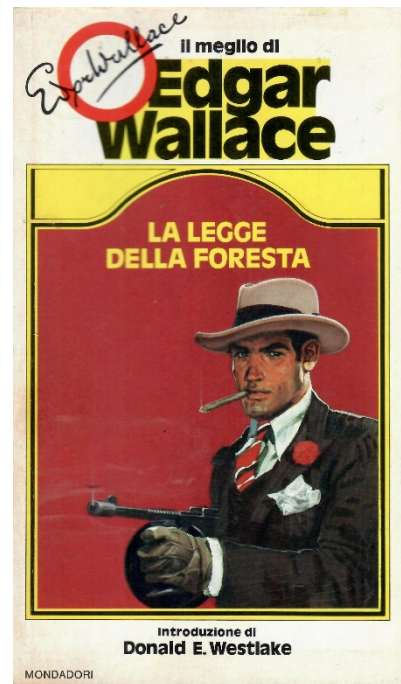
La legge della foresta (On the spot, 1931), trad. Giorgio Monicelli, Mondadori, Milano, 1982, pp. 224

Col caldo che fa in questo periodo è già tanto se si riesce a occuparsi di letture poco impegnative, e se sono libri di Edgar Wallace è una buona evenienza. Wallace, per quanto scrivesse in modo veloce e assai essenziale, fu sempre in grado di caratterizzare i suoi romanzi in maniera chiara, e non poche volte riserva delle sorprese.