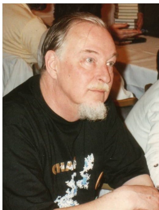
John Kilian Houston Brunner (1934-1995)

Un classico della fantascienza inglese. In un imprecisato futuro, Gerald Howson, un uomo nato deforme e fisicamente assai limitato, scopre di avere grandi doti telepatiche e in tal modo esce dal suo disadattamento e viene coinvolto in un istituto che raccoglie persone con le stesse qualità al fine di influenzare positivamente il mondo, guarendo gli squilibri, rinnovando le energie psichiche, neutralizzando le psicosi più gravi. Questa attività lo pone in rapporto con una quantità di situazioni inconsuete e lo sottopone a rischi notevoli ma è anche il tramite per cui, nell'empatia con gli altri, lui riesce infine a raggiungere una sensazione di completezza (da cui il titolo originale: The Whole Man ).