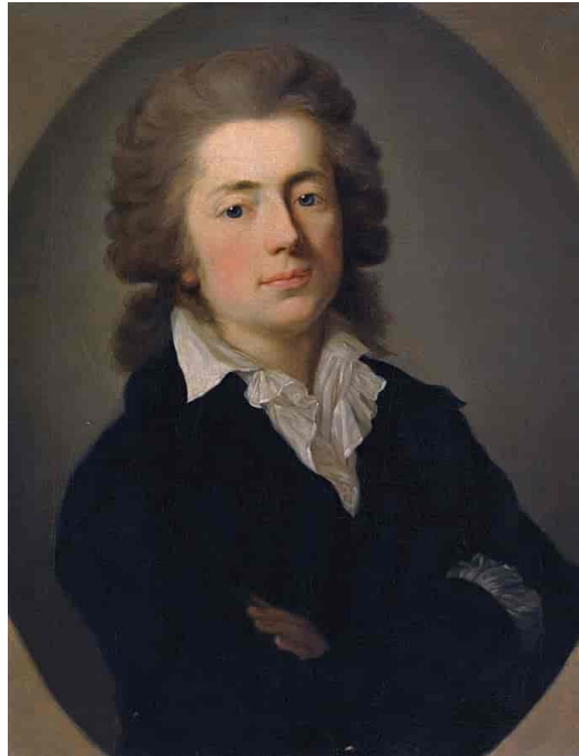
Jan Potocki dipinto da Anton Graff

H o finalmente letto la versione integrale del Manoscritto trovato a Saragozza , di cui tantissimi anni fa avevo letto l'edizione molto parziale pubblicata da Adelphi.