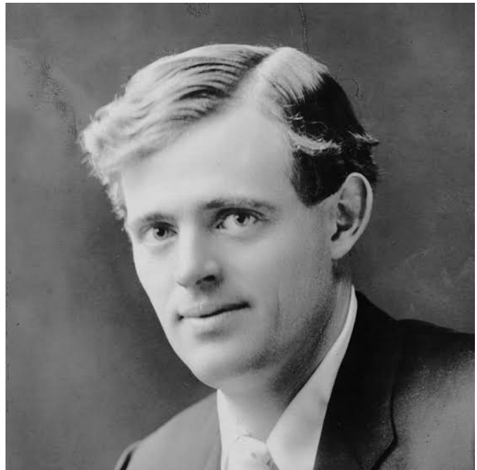
Jack London (1876-1916)

Una serie di storie godibilissima, ognuna con una sua chiara idea ispiratrice. Avevo letto solo un paio di libri di Jack London, Il popolo dell'abisso e Il Vagabondo delle Stelle , oltre, durante l'infanzia, Il richiamo della foresta e Zanna Bianca .