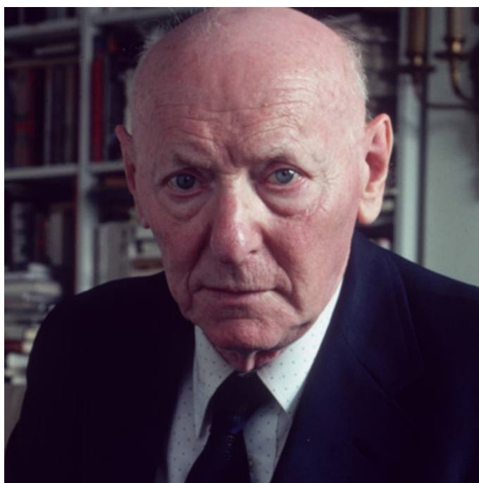
Isaac Bashevis Singer (1904-1991)

H o letto questo notevole libro di Isaac Bashevis Singer, che parla delle vicende che accadono in una comunità chassidica polacca poco dopo gli stermini operati ai danni di ebrei e polacchi dall'atamano cosacco Bohdan Chmel'nyc'kyj.