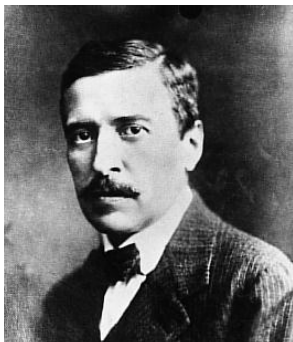
Hugo von Hofmannsthal

Ci sono scrittori che si leggono avidamente anche se hanno dei difetti, perché ci interessa quello che vogliono dire. Io per esempio ho negli anni letto e riletto con interesse Meyrink e Lovecraft, anche se il primo è talvolta un po' approssimativo e il secondo spesso non sa andare oltre un'aggettivazione esagerata. Tuttavia fanno intravedere un'idea di mondo tutta loro, e questo è interessante.