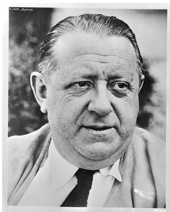
Hendrik Willem van Loon

Ho finito di leggere con grande soddisfazione La vita e i tempi di J.S. Bach di Hendrik Willem van Loon. Una lettura chiara, non troppo lunga e non troppo complessa, ma che getta luce su molti aspetti dell'epoca e della vita di Bach.