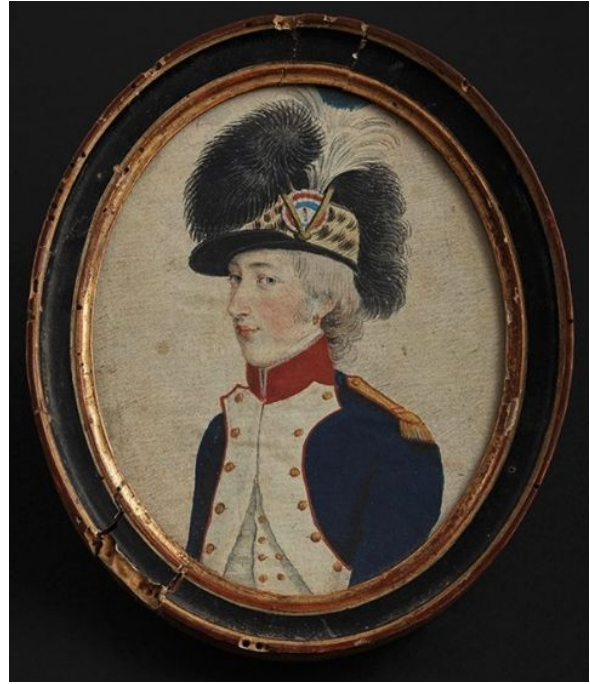
Marie-Henriette Heiniken (Madame de Xaintrailles, morta nel 1818), dipinto di artista ignoto, 1800, American Folk Art Museum, New York

Commenta la Masonic Encyclopedia in linea 4 , riferendosi anche al caso di Elizabeth Aldworth 5 nata St Leger che fu iniziata per mantenere il segreto massonico, in quanto si era addormentata in un locale adiacente alla loggia aperta in casa sua da suo padre e, risvegliatasi, aveva assistito a parte della seduta: “Senza dubbio la loggia irlandese fu, in tutte le circostanze, scusata, se non giustificata, nell’iniziazione di Miss Saint Leger. Ma per il ricevimento di Madame de Xaintrailles cerchiamo invano la minima ombra di scuse. L’oltraggio ai loro obblighi di massoni da parte dei membri della loggia parigina meritava ampiamente la punizione più severa, che non avrebbe dovuto essere evitata con la scusa che l’offesa era stata commessa in un improvviso spirito di entusiasmo e galanteria”.