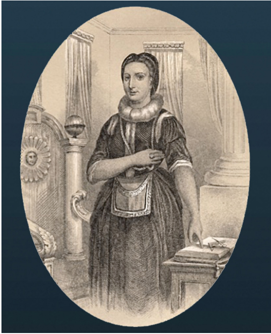
Elizabeth Aldworth, nata St Leger (1693/5–1773/5), in tenuta massonica, immagine tratta da http://www.irish-masonichistory.com/elizabeth-aldworth-st-leger-the-lady-freemason.html