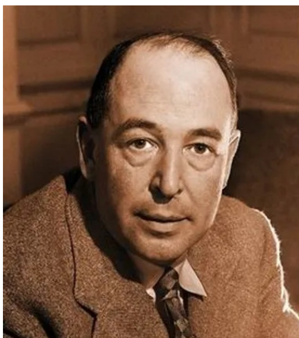
Clive Staples Lewis

H o letto questo libriccino dopo aver visto “Viaggio in Inghilterra” (“Shadowlands”), film di Richard Attenborough del 1993, recitato da due attori eccellenti: Anthony Hopkins nel ruolo di C.S. Lewis e Debra Winger nel ruolo di Joy Gresham, che fu sua moglie per pochi anni e di cui Lewis adottò i due figli (nel film ne compare solo uno). Joy morì dopo pochi anni di cancro e fu per suo marito un dolore profondissimo. Le sopravvisse tre anni.