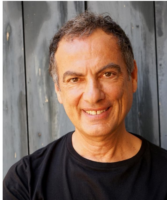
Andrea De Carlo

H o appena finito di leggere Yucatan di Andrea De Carlo, un romanzo ispirato a un viaggio compiuto dallo stesso De Carlo come assistente di Fellini alla ricerca di Castaneda, per il film “Viaggio a Tulum” che rimase allo stato di progetto.